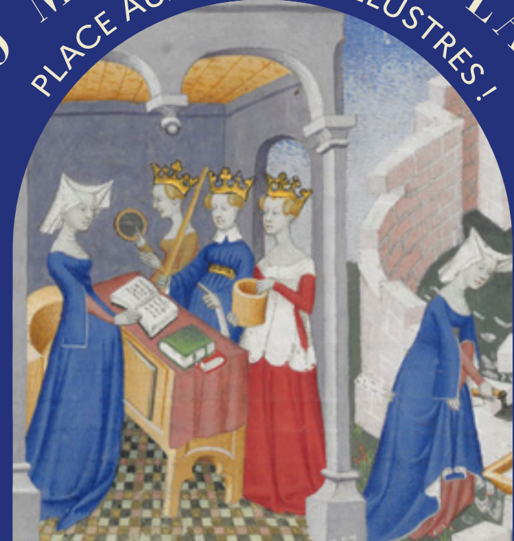
Miniature du xve siècle attribuée au maître de la Cité des dames (BNF).

PREMIER COLLOQUE INTERNATIONAL DU LUPERCAL